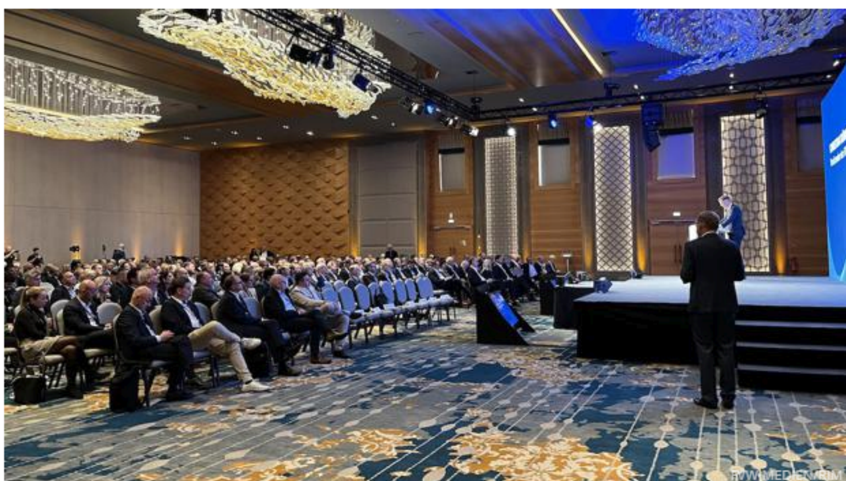
Der DRV Hauptstadtkongress findet im Hotel Titanic Berlin Chaussee statt.

von Cüneyt Yilmaz | Freitag, 09. August 2024